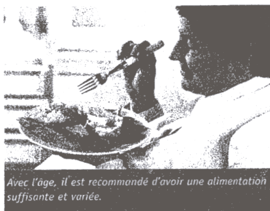
Avec l'âge, il est recommandé d'avoir une alimentation suffisante et variée.

N on, il n'est pas normal de maigrir en vieillissant. Bien sûr, avec l'âge, le goût s'altère, l'appétit est moindre, le besoin de boire aussi. Les problèmes gastriques s'accroissent parfois. Mâcher ou déglutir devient plus difficile, tout comme faire ses courses, préparer des repas équilibrés. Pas question pour autant de laisser s'installer ces modifications physiques et physiologiques, et leurs conséquences. Car, c'est courir le risque de ne pas satisfaire ses besoins nutritionnels, de voir sa masse musculaire fondre et son état général se dégrader encore plus rapidement. Entre 450 000 et 500 000 Français(es) âgé(e)s de plus de 65 ans seraient ainsi dénutri(e)s, au point, dans le pire des cas, de voir leur pronostic vital mis en jeu.